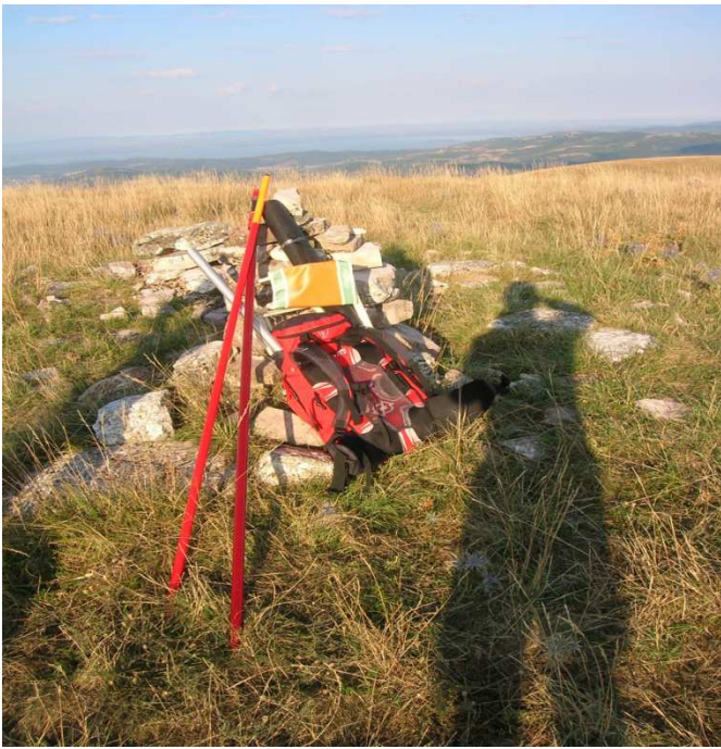
Tutto il materiale