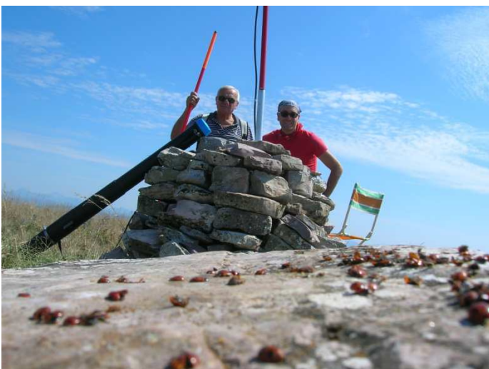
Noi e le coccinelle...