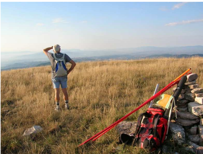
Prima di montare tutto