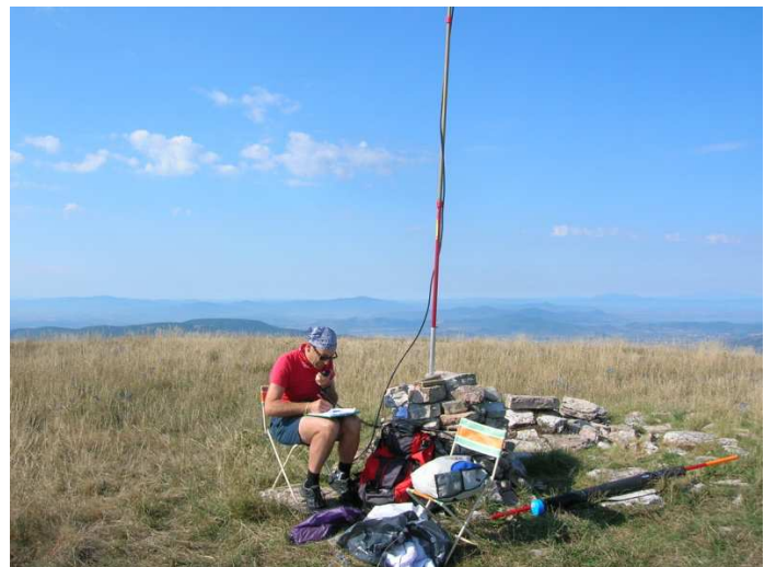
Durante il contest