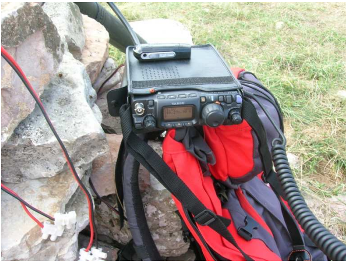
Il mitico 817 con ospiti...