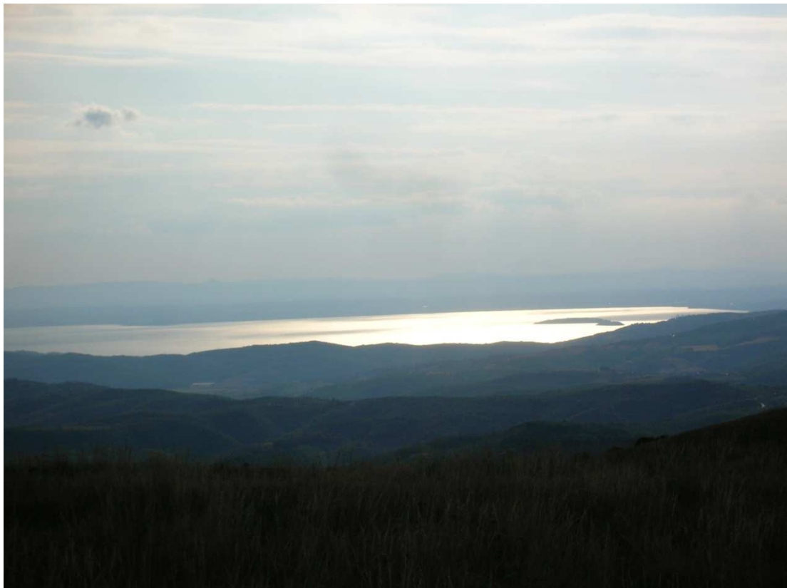
Il lago Trasimeno "dorato"