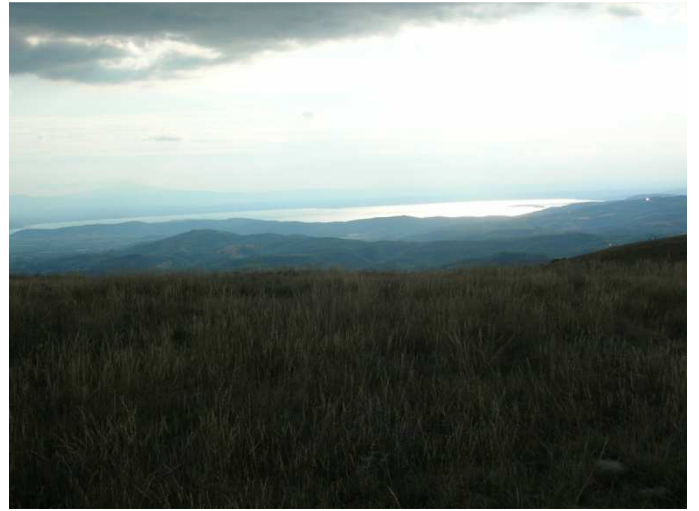
Panorama sul lago